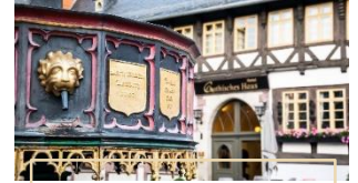
GOTHISCHES HAUS WERNIGERODE