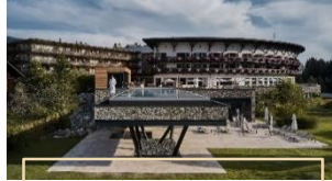
IFEN HOTEL KLEINWALSERTAL