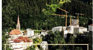
BADESCHLOSS BAD GASTEIN