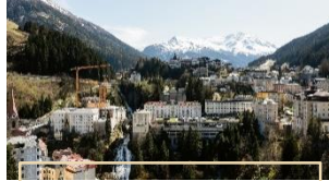
STRAUBINGER BAD GASTEIN