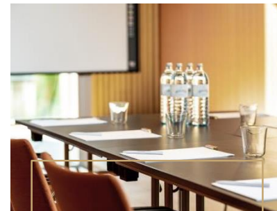
KAPAZITÄTEN & PREISE