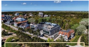
URBAN NATURE ST. PETER-ORDING