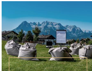
TAGEN MAL ANDERS