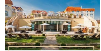
NORDPERD & VILLEN GÖHREN