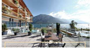
FÜRSTENHAUS AM ACHENSEE

Travel Charme Hotel GmbH & Co. KG Budapester Straße 10 - D-10787 Berlin